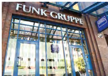
Der Eingang der Funk-Zentrale am Valentinskamp 20 in der Hamburger Innenstadt

»Wir sprechen Unternehmen und Entscheidern weltweit die beste Empfehlung für ihre Sicherheit und Vorsorge aus.«