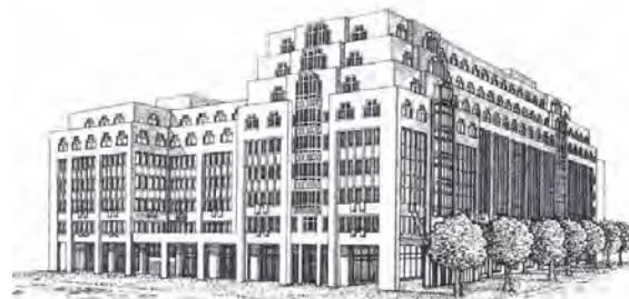
Zeichnung der Hamburger Zentrale von Funk

Partnerschaften widmet. Bei Funk fühlt man sich verpflichtet, für dauerhafte und stabile Gesellschafter- und Geschäftsführerverhältnisse zu sorgen, und plant Übergänge langfristig. Das Mehrgenerationenmodell ist Teil der Unternehmenskultur und Erfolgsrezept in der mittlerweile über 135-jährigen Geschichte des inhabergeführten Unternehmens.